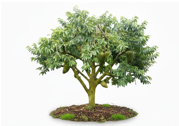
Figura 12. Cultivo de guanábana ( Annona muricata L.) con frutos en desarrollo

Ilustración botánica de un árbol de guanábana ( Annona muricata L.), mostrando copa amplia con hojas grandes, enteras y brillantes, junto con frutos verdes de gran tamaño distribuidos en distintas ramas. Imagen generada con IA por el autor (2025).