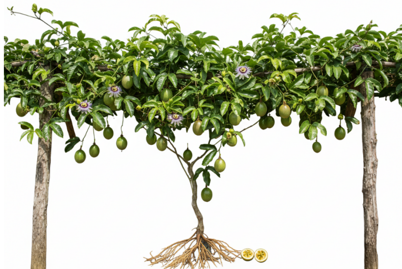
Ilustración botánica de una planta de maracuyá ( Passiflora edulis ), mostrando la enredadera trepadora con hojas trilobuladas, flores moradas y blancas características, frutos en diferentes etapas de desarrollo colgando de la planta. Imagen generada con IA por el autor (2025).

Figura 6. Cultivo de maracuyá ( Passiflora edulis ) en sistema de espaldera