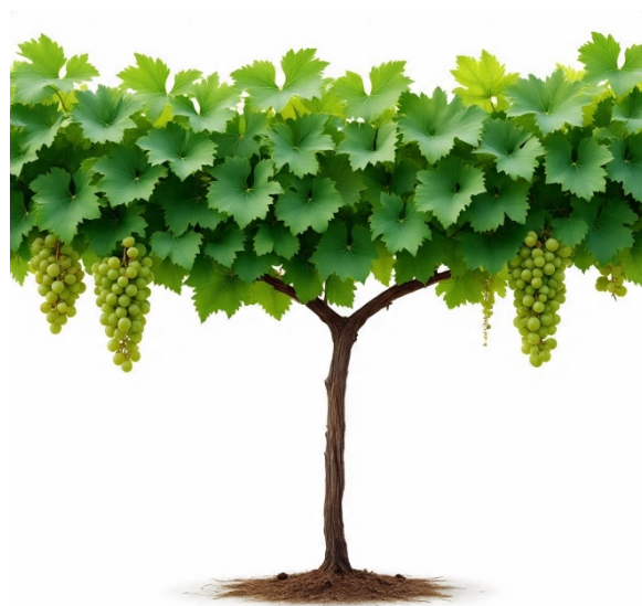
Figura 9. Cultivo de uva ( Vitis vinifera L.) en parral

Ilustración botánica de una planta de uva ( Vitis vinifera L.), mostrando el tallo leñoso conducido en espaldera, hojas palmadas de gran tamaño y racimos de frutos colgando en diferentes etapas de desarrollo. Imagen generada con IA por el autor (2025).