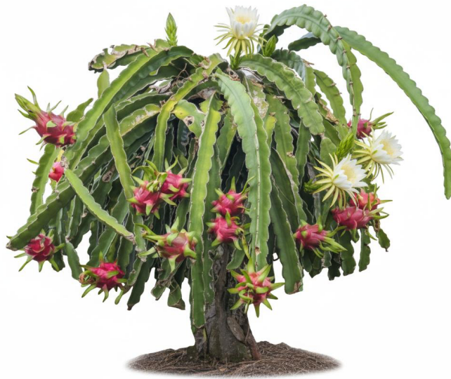
Ilustración botánica de una planta de pitahaya ( Hylocereus megalanthus ), mostrando tallos succulentos con forma triangular, flores blancas grandes y frutos de color rojo con brácteas verdes en distintas etapas de desarrollo. Imagen generada con IA por el autor (2025).

Figura 10. Cultivo de pitahaya ( Hylocereus megalanthus ) con frutos y flores