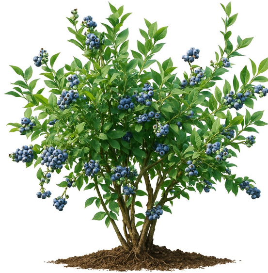
Figura 11. Cultivo de arándano ( Vaccinium corymbosum ) con frutos maduros

Ilustración botánica de un arbusto de arándano ( Vaccinium corymbosum ), mostrando ramas múltiples, hojas pequeñas de color verde brillante y racimos de frutos azules en distintas etapas de maduración. Imagen generada con IA por el autor (2025).