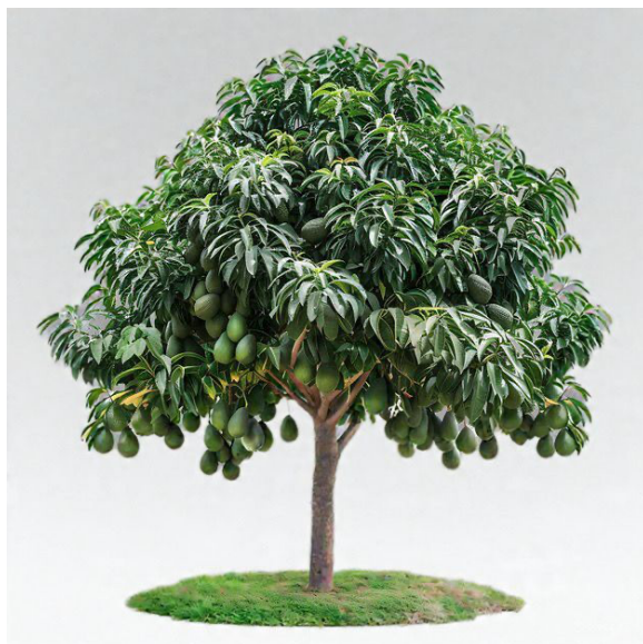
Figura 8. Cultivo de aguacate ( Persea americana Mill. ) con frutos en desarrollo

Ilustración botánica de un árbol de aguacate ( Persea americana Mill. ), mostrando follaje denso, hojas lanceoladas de color verde oscuro y frutos colgando en racimos alrededor de toda la copa. Imagen generada con IA por el autor (2025).