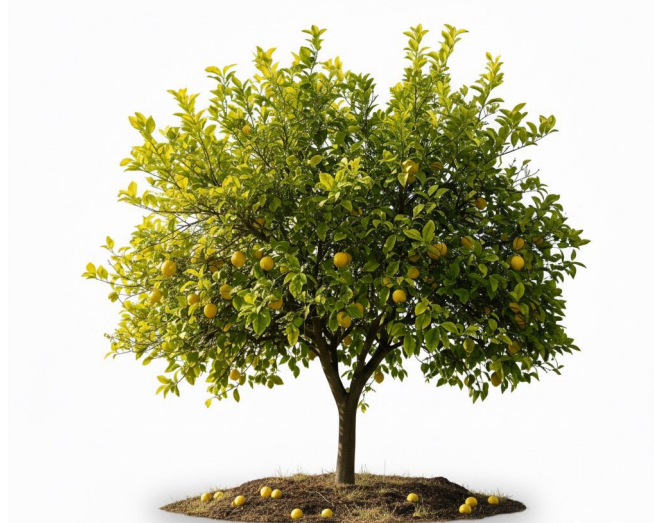
Figura 7. Cultivo de cítricos ( Citrus spp. ) con frutos en desarrollo

Ilustración botánica de un árbol de cítricos ( Citrus spp. ), mostrando copa densa, hojas perennes de color verde brillante y frutos en etapa de maduración distribuidos en toda la planta, algunos caídos alrededor del suelo. Imagen generada con IA por el autor (2025).