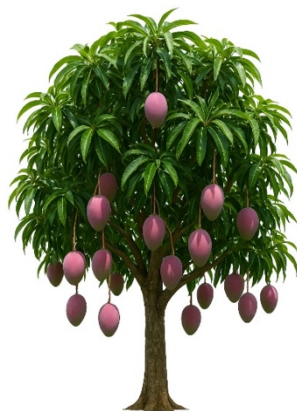
Figura 3. Cultivo de mango ( Mangifera indica L.) con frutos en desarrollo

Ilustración botánica de un árbol de mango ( Mangifera indica L.), mostrando hojas, ramas y frutos en etapa de desarrollo. Imagen generada con IA por el autor (2025).