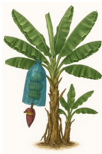
Figura 1. Planta de banano ( Musa spp. ) con racimo protegido

Ilustración botánica de una planta de banano ( Musa spp. ), mostrando el racimo en etapa de desarrollo cubierto con funda de protección y la inflorescencia colgante. Imagen generada con IA por el autor (2025).