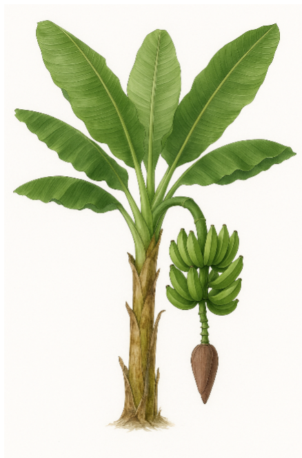
Figura 2. Planta de plátano verde ( Musa AAB ) con racimo en desarrollo

Ilustración botánica de una planta de plátano verde o de cocción ( Musa AAB ), mostrando hojas, tallo y un racimo en etapa de desarrollo sin funda de protección, acompañado de la inflorescencia colgante. Imagen generada con IA por el autor (2025).