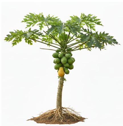
Figura 4. Cultivo de papaya ( Carica papaya L. ) con frutos en desarrollo

Ilustración botánica de una planta de papaya ( Carica papaya L. ), mostrando hojas palmeadas, tallo único, sistema radicular y un racimo de frutos en distintas etapas de maduración. Imagen generada con IA por el autor (2025).